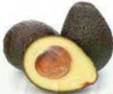
el aguacate la palta