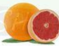
la toronja el pomelo