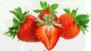
la fresa la frutilla