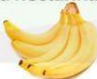
el plátano la banana