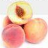
el melocotón el durazno