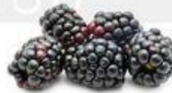
la mora la zarzamora