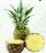
la piña la araña