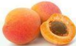
el albaricoque el damasco