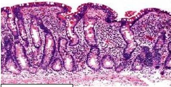
الزغابات المعوية لاحمد

السيلياك مرض يصيب الأمعاء الدقيقة بسبب الحساسية لبروتين الغلوتين (Gluten) الموجود في دقيق القمح، يتسبب الغلوتين في التهاب جدار الأمعاء الدقيقة وإتلاف الزغابات المعوية.