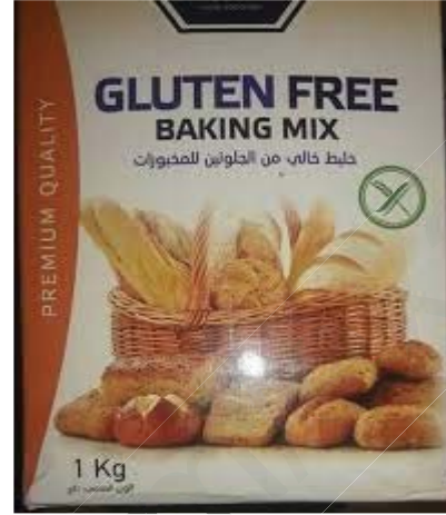
غذاء خال من الغلوتين