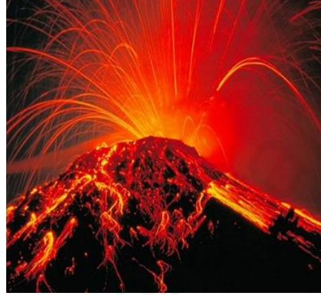
الوثيقة : 01 صور مأخوذة عن بركان ميستي ببيرو