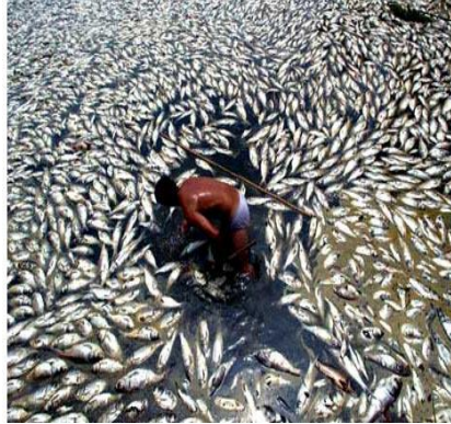
سند 2 / البترول مصدر للتلوث