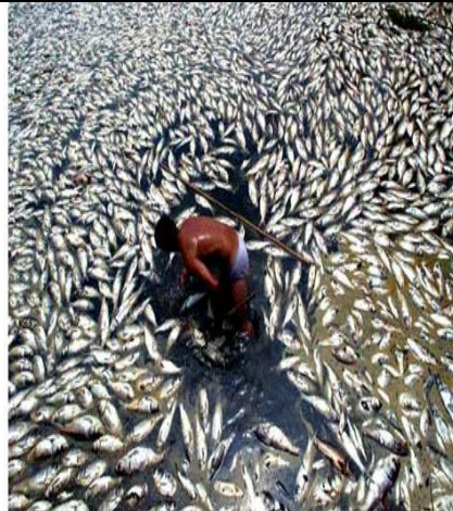
سند 2 / البترول مصدر للتلوث