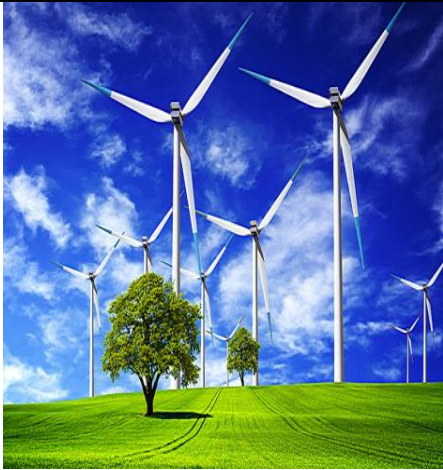
سند 3 / استغلال طاقة الرياح