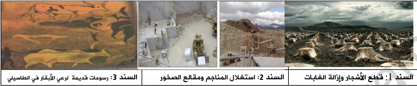
السند 1: قطع الأشجار وإزالة الغابات

لدراسة تطور منظر طبيعي عبر الزمن الجيولوجي قدمت لك السندات التالية: