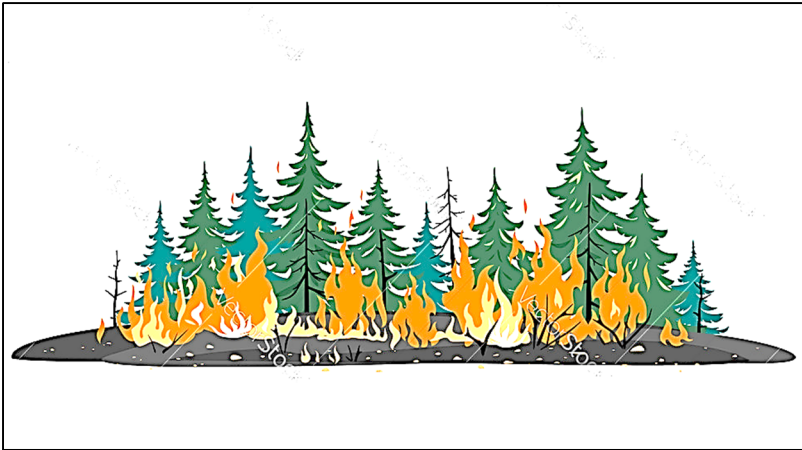
السند 02: حرائق الغابات خطر على النظام البيئي