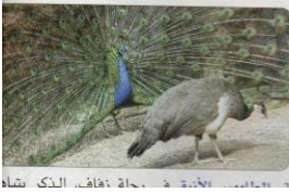
طاوس في حفلة زفاف