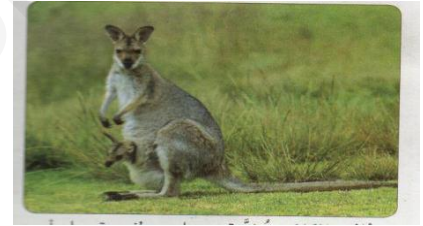
انثى الكنغر مزودة بجراب بطني يحتوي على