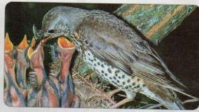
صائر السمان وصغاره