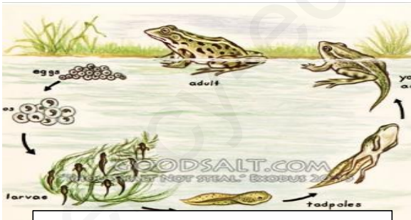
سند 01: دورة حياة الضفدع