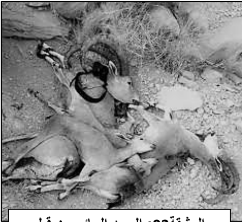
الوثيقة 03: الصيد الجائر من قبل إحدى الصيادين بصحراء الجزائر