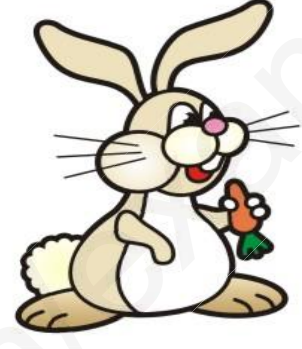
سند1: أرنب يتناول الجزر