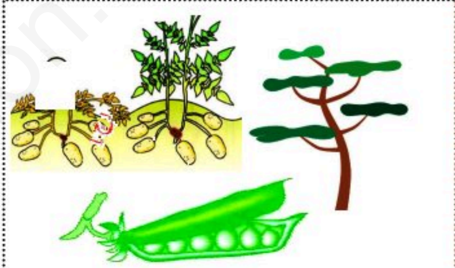
الوثيقة 03 : أنماط المقاومة عند الاصناف النباتية