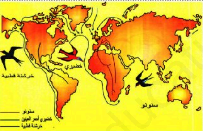
الوثيقة 02 : استراتيجيات المقاومة عند الطيور