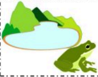
المجموعة : 02