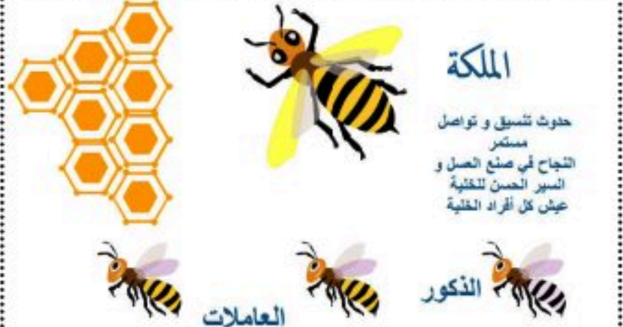
الوثيقة 01 : تجربة أحمد