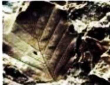
بصمة ورقة نبات