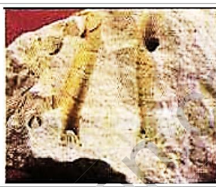
جزء من مستحاثات المرجان