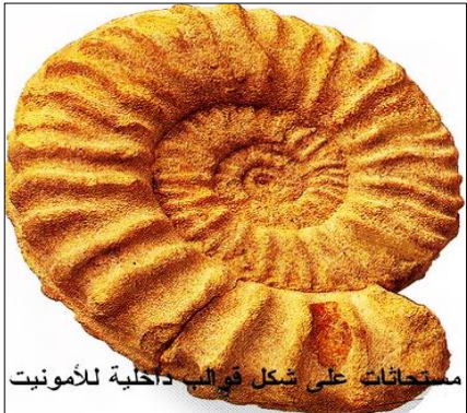
مستحاثات على شكل قوالب داخلية للأمونيت