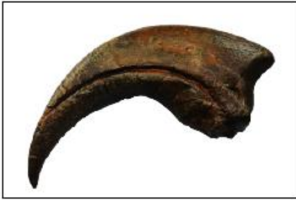
بقايا لمخالب طائر