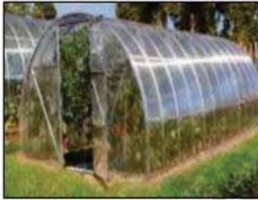
01 - الزراعة في البيوت البلاستيكية

01 - حدد العوامل التي نستطيع التحكم بها في البيوت البلاستيكية وماهي الفائدة منها .