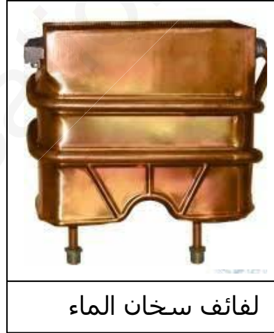
لفائف سخان الماء