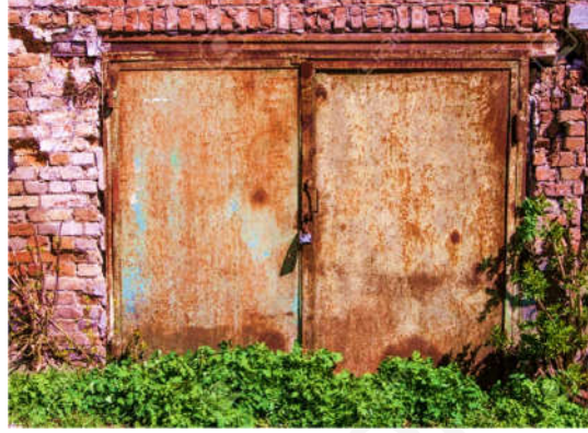
السند 2: باب حديدي صدئ

أكسيد الحديد الثلاثي ← غاز الأوكسجين + الحديد