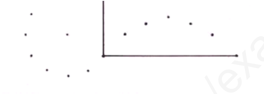
الشكل - 1 -