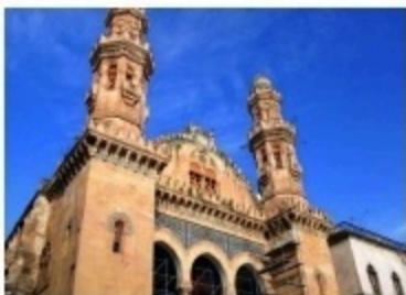
مسجد كتنشواة بالعاصمة و الذي حول الى كنيسة في عهد الاستعمار الفرنسي

السند: 02) (لقد وضعنا أيدينا على أموال الوقف و قضينا على مدارس و مساجد كانت موجودة...)) تقرير لجنة لاسكوتار الفرنسية 1878م