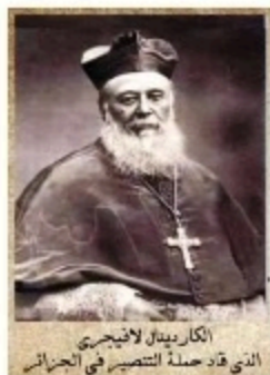
الكاردينال لانيجرى الذي قاد حملة التنصير في الجزائر