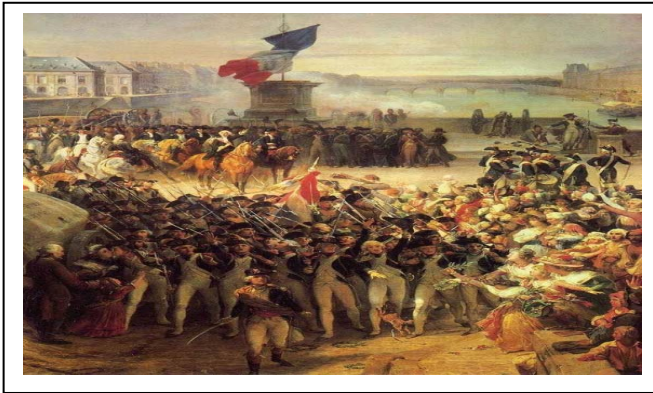
السند -2 :-