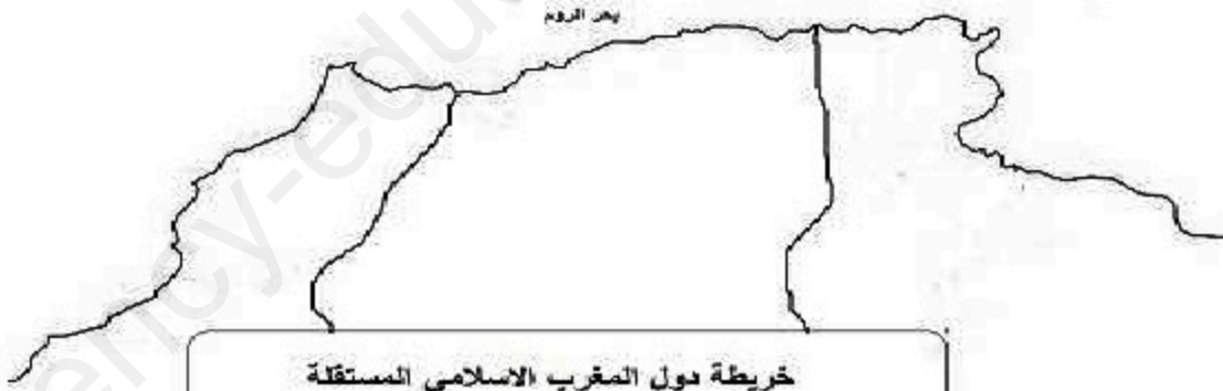
خريطة دول المغرب الاسلامي المستقلة

- إليك خريطة المغرب الإسلامي الصماء. المطلوب: - وقع عليها دول المغرب المستقلة مع تحديد عواصمها؟