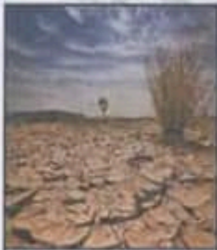
التصحر و الجفاف

ضع تحت كل صورة نوع المشكل الذي تواجهه الجزائر :