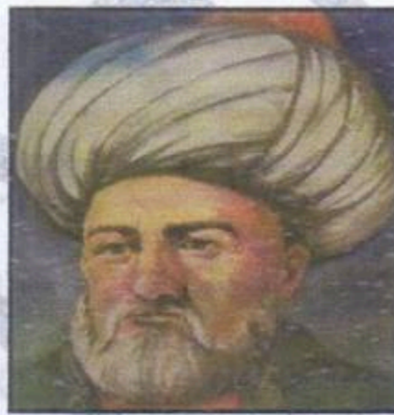
خير الدين برباروس