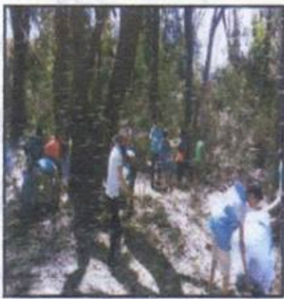
المحافظة على البينة