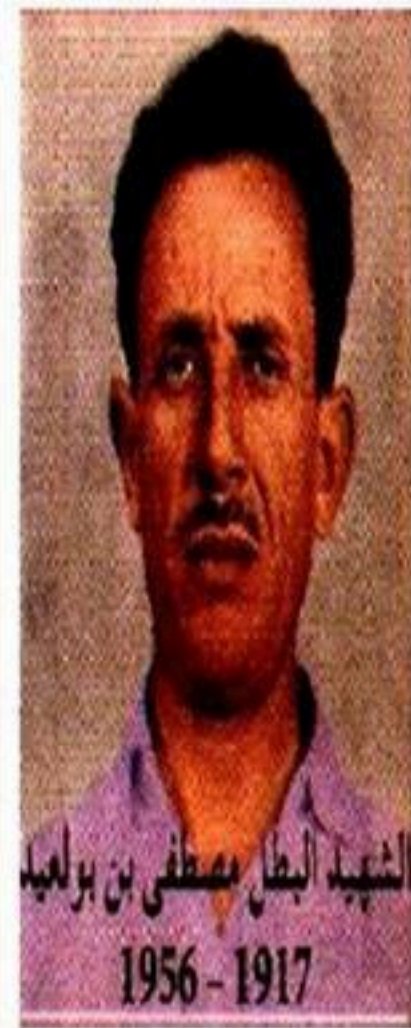
الشهيد البطل مصطفى بن بولعيد 1956 - 1917